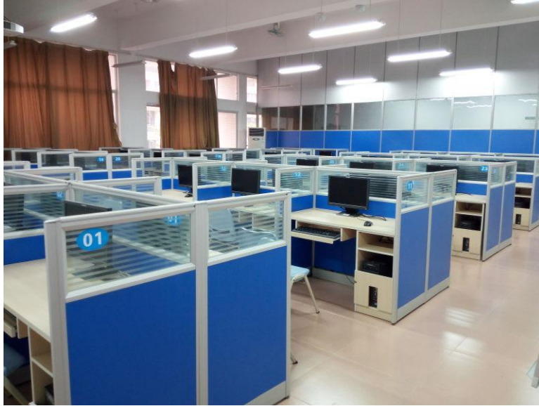
E213 软件工程中心布局图