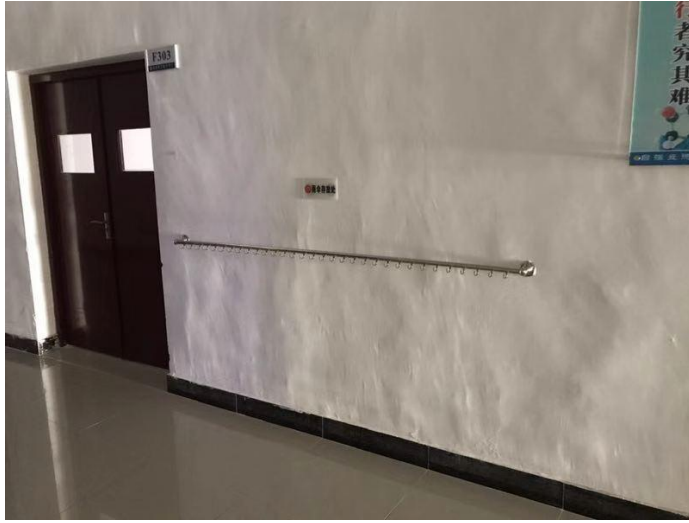
F303 互联网+智能应用开发中心