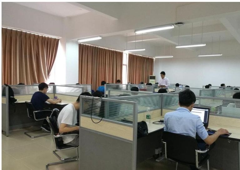
FG301IT 服务外包研发中心